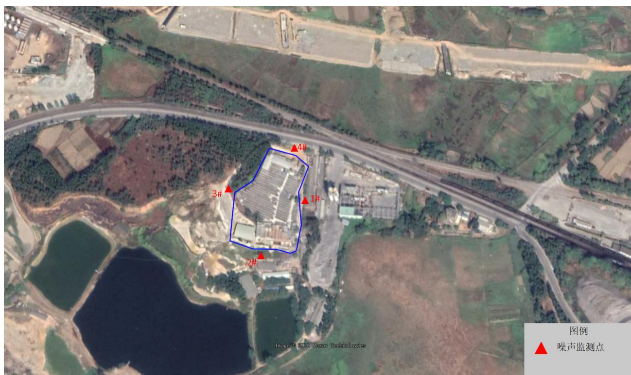
图 2 监测点位布设图